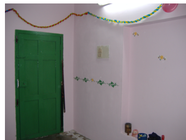
La pièce une fois terminée