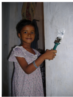
Le Sakthi en travaux